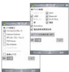
オフライン版設定画面

不正取得者へのデータ漏洩を防ぐだけでなく、利用者が管理者の意図に反した使い方をしてセキュリティ上の脆弱性が高まることを防止します。